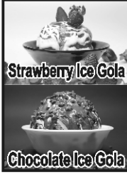
Strawberry Ice Gola