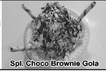
Spl. Choco Brownie Gola