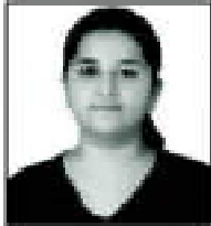
SANSKRITI 299 400